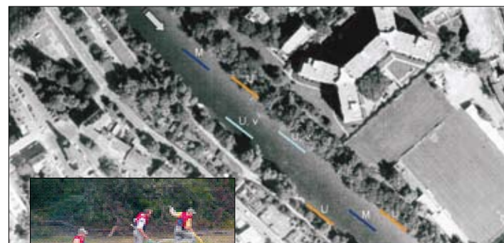
Abb. 2: Aufsicht eines befischten Flussabschnittes mit schematisch dargestellten Befischungsstreifen; U = Uferstreifen, U,v = versetzter Uferstreifen, M = Mittelstreifen.