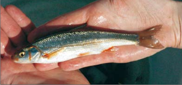
Abb. 5: Der Strömer, eine hochgradig gefährdete Fischart, kommt in der Grazer Mur noch häufig vor.

vollen Kleinfischarten nur 28 % aus, was als klares Indiz für den Erfolg der Uferstrukturierungen zu werten ist. Außerdem wurden im Maßnahmenbereich Fischdichten von 6.650 Individuen am Hektar errechnet; sie sind somit 2,8mal höher als jene in den Uferbereichen ohne Restrukturierungsmaßnahmen (2.366 Ind./ha). Auch die Biomasse von 228,4 kg/ha für den Maßnahmenbereich liegt über jener der Bereiche ohne Maßnahmen (213,4 kg/ha).