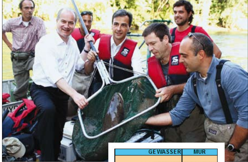
Abb. 4: Direkt neben der Murinsel wurde ein kapitaler Huchen gefangen